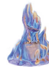
Baked Alaska Ice Cream Cake