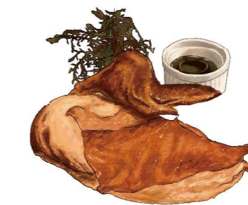
Roasted Daisen Tomahawk Chicken