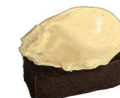
Gâteau au Chocolat